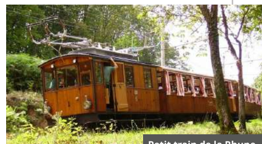
Petit train de la Rhune